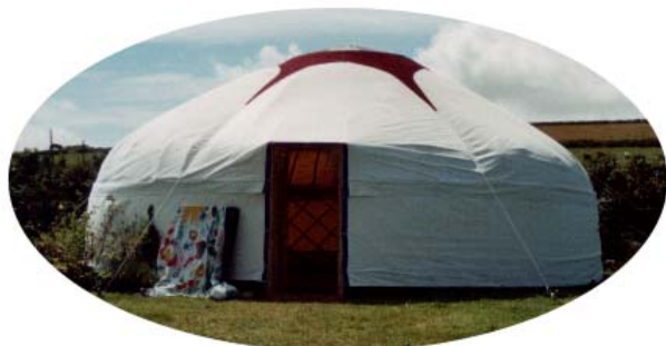
Foto van de yurd op het Lammas Camp. De yurd is van oorsprong de tent van de nomaden in Tibet. Het is een fantastische 'sacred space' om in te dansen, chanten en sharen.

Evenals vorig jaar gaan we weer naar het uiterste puntje van Cornwall om in dit magische Keltische gebied de oogst van de zomer te vieren en eren. Een echt familiekamp met strand, uitstapjes naar steencirkels, dansen en chanten, yoga en wat er verder ontstaat. Een echt doe-het-zelf kamp in de sfeer van de Unicorn.